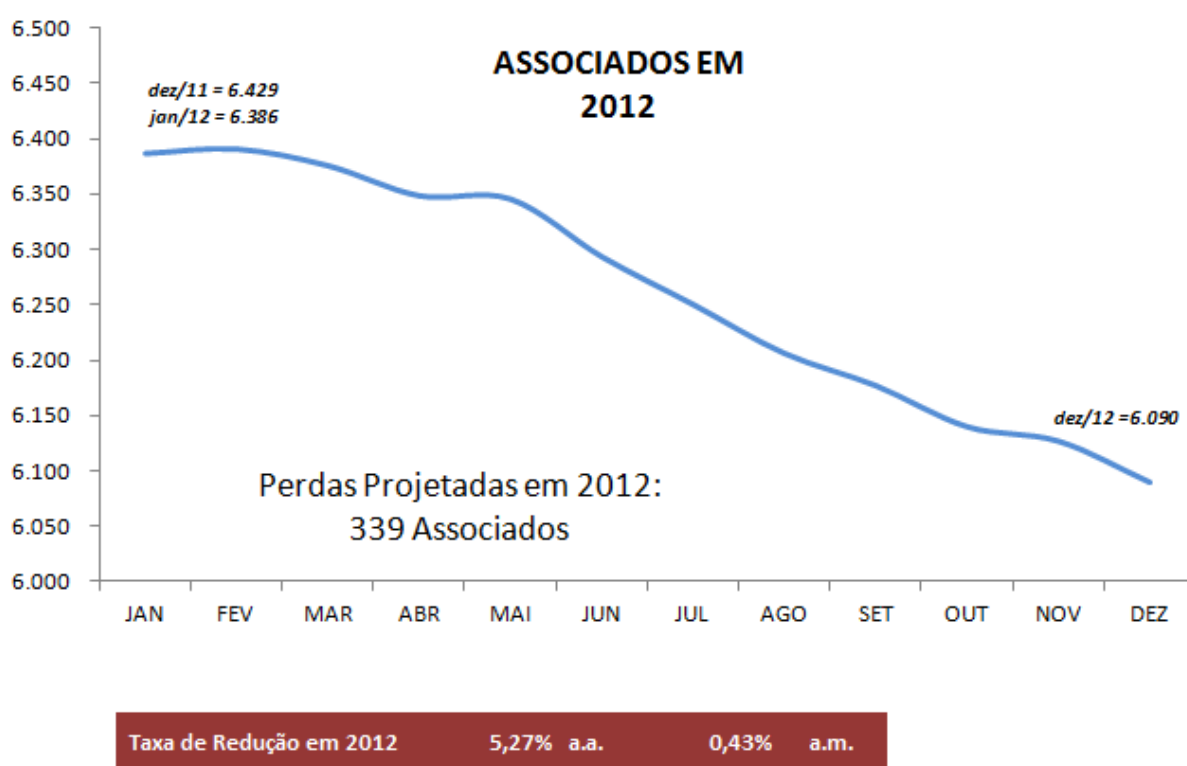
Gráfico 1: Evasão de Associados – Realizado em 2012

Para elucidar de forma mais resumida, em 2009, 2010 e 2011 a GREMIG perdeu 616, 728 e 459 associados respectivamente. A evasão de 2012 foi de 339 associados, como mostra o gráfico 1. Sendo assim, isso significa uma redução na evasão de associados de 26,1% comparado com o último ano e 43,6% com a média do último triênio.